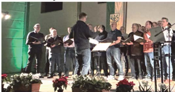
Auftritt des Gesangvereins Liederkranz Schutterwald

Der Gesangverein umrahmte den Abend musikalisch und trug zur festlichen Stimmung bei.