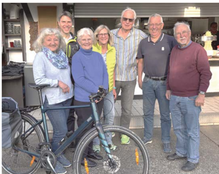
Das Partnerschaftskomitee unternahm eine Radtour zur Kittersburger Mühle und bereitete den Besuch in St. Denis vor.

Das Partnerschaftskomitee Schutterwald traf sich kürzlich zu einer gemeinsamen Besprechung, um den geplanten Besuch einer Delegation beim Europamarkt am 22.05.2026 in unserer französischen Partnergemeinde Saint-Denis-lès-Bourg vorzubereiten.