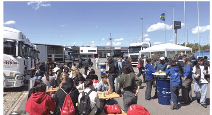
Abschluss der Veranstaltung bei der Fa. Knirsch

Am 21. April 2026 fand in Schutterwald erstmals die Veranstaltung „Jobs Backstage“ statt. Insgesamt 245 Schülerinnen und Schüler aus der Astrid-Lindgren-Schule Offenburg, der Mörburgschule Schutterwald, der Gemeinschaftsschule Hohberg sowie der Theodor-Heuss-Realschule Offenburg nutzten die Gelegenheit, einen praxisnahen Einblick in verschiedene Berufsfelder zu erhalten.