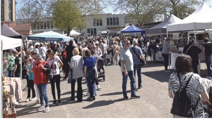
Ostermarkt im vergangenen Jahr

Am Samstag, 28. März 2026 , lädt die Gemeinde Schutterwald herzlich zum Ostermarkt auf dem Schulhof der Mörburgschule ein. Der Markt beginnt um 13:00 Uhr und bietet beste Gelegenheit, gemeinsam in den Frühling zu starten. Der Ostermarkt hat sich in den vergangenen Jahren zu einer festen Größe im Veranstaltungskalender entwickelt – und wächst weiter: In diesem Jahr beteiligen sich rund 60 Stände und damit doppelt so viele wie im Vorjahr. Die Besucherinnen und Besucher erwartet eine große Vielfalt an Angeboten aus Handwerk, Kulinarik, Kreativität und Vereinsleben.