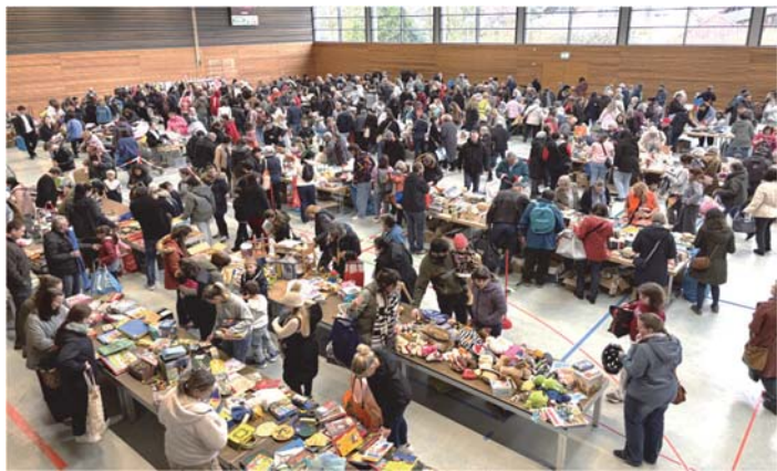
Blick in die Mörburghalle II kurz nach der Eröffnung um 15.00 Uhr.

Am vergangenen Samstag war es wieder soweit: Der 60. Warentauschtag des Amtes für Abfallwirtschaft fand statt, und Schutterwald war bereits zum sechsten Mal mit Begeisterung dabei. Viele Bürgerinnen und Bürger nutzten die Gelegenheit, gut erhaltene, aber nicht mehr benötigte Gegenstände abzugeben – darunter Kinderwagen und zahlreiche weitere brauchbare Dinge.