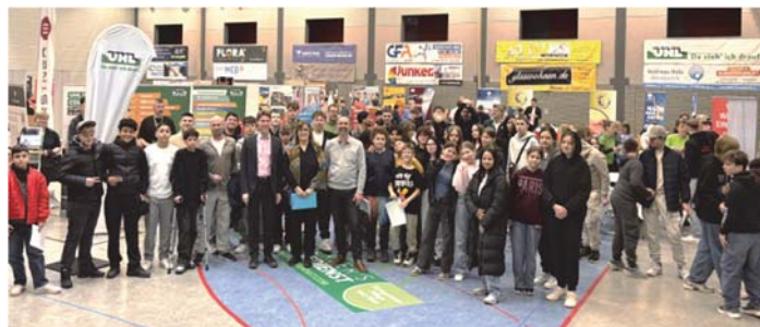
Die Eröffnung der Jobbörse.

Bereits zum fünften Mal fand am 12. März die Jobbörse der Mörburgschule statt. 32 Unternehmen aus Schutterwald und der Umgebung nutzten die Gelegenheit, ihre Ausbildungsberufe und beruflichen Perspektiven vorzustellen und mit den Schülerinnen und Schülern ins Gespräch zu kommen.