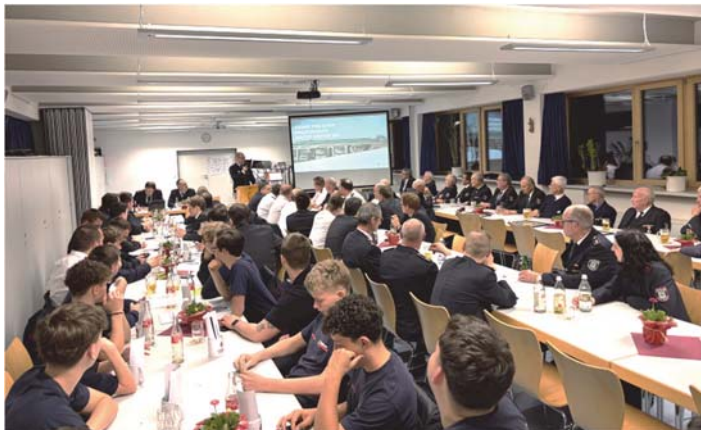
Bei der Hauptversammlung der Freiwilligen Feuerwehr

Zur Hauptversammlung der Freiwilligen Feuerwehr Schutterwald kamen die Angehörigen der Einsatzabteilung, der Altersabteilung und des Spielmannzuges, sowie Vertreter aus Gemeinde und Feuerwehrführung zusammen, um das vergangene Jahr Revue passieren zu lassen, verdiente Kameradinnen und Kameraden zu ehren und den Feuerwehrausschuss neu zu wählen.