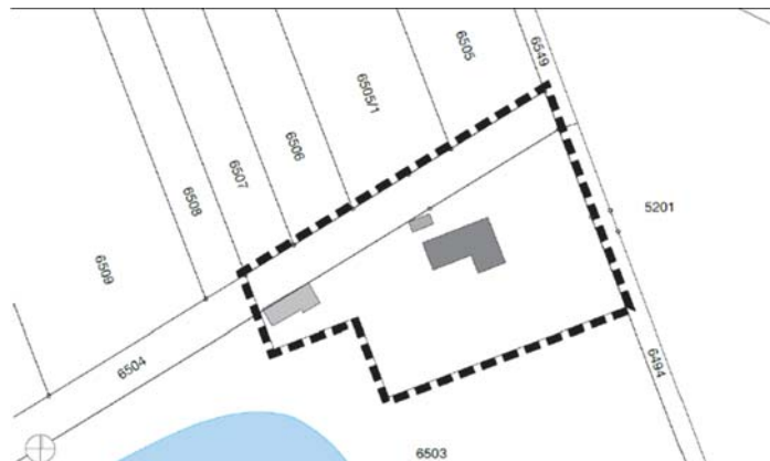
Geltungsbereich 7. Teil-Änderung des Bebauungsplans "Freizeitzentrum Schutterwald" - ohne Maßstab

Er ergibt sich aus folgendem Kartenausschnitt: