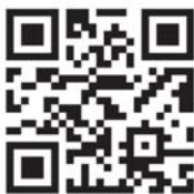
Zur Seite der LpB