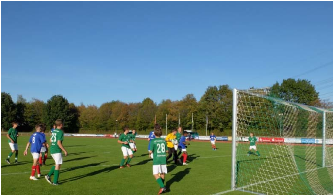
Nach einem kleinen Spaziergang zum Waldstadion stand das Fußballspiel zwischen dem FV Schutterwald und Olympique St. Denis auf dem Programm. Die Gäste gewannen knapp mit 2:1.