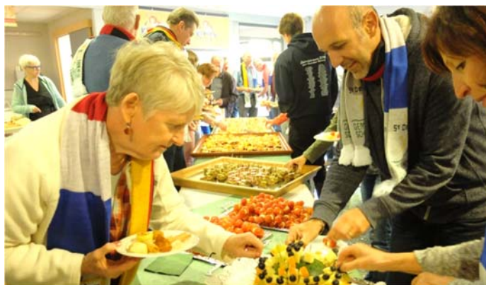
Nach einer kleinen Stärkung ...