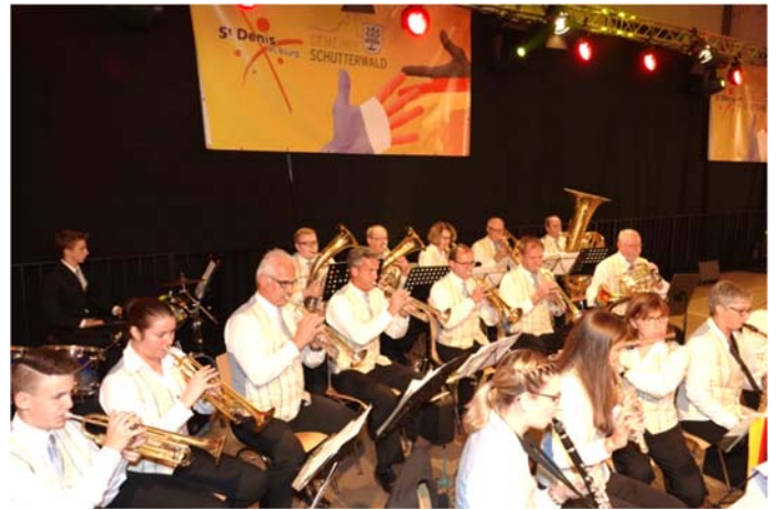
und der Musikverein Schutterwald mit stimmungsvoller Musik.