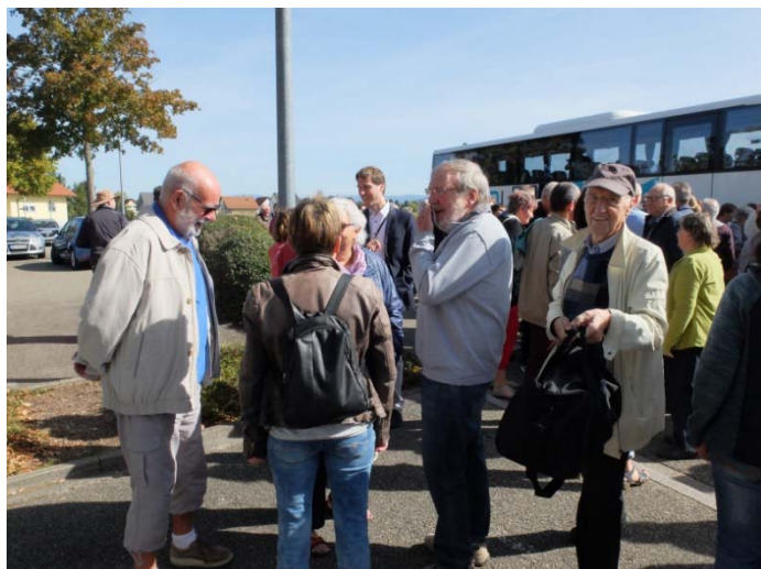
Begrüßung bei der Ankunft unserer französischen Freunde

Selbst das Wetter, das wohl bei Unterzeichnung der Partnerschaftsurkunde 1988 regnerisch war, zeigte sich dieses Mal von der besten Seite. Hier ein paar Eindrücke des vergangenen Wochenendes.