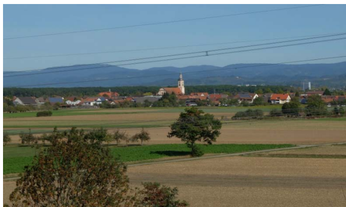
... dem Monte Scherbelino, von wo unsere Gäste bei herrlichem Wetter eine wunderschöne Aussicht genießen konnten.