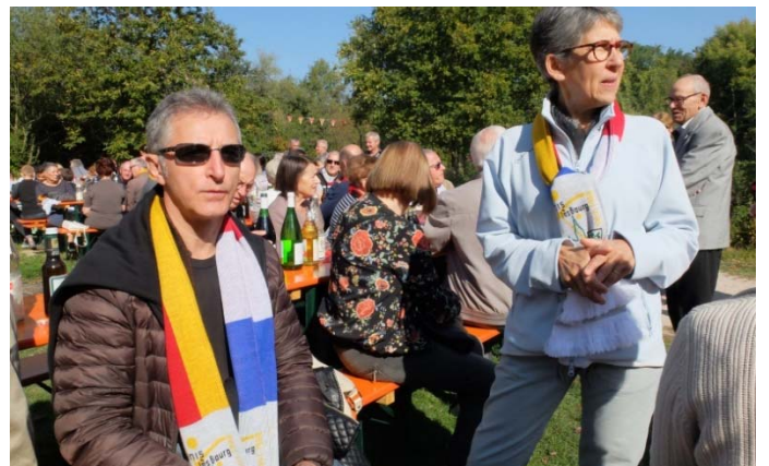
Nach einem Spaziergang um den Baggersee folgte eine Rast am Anglerheim.