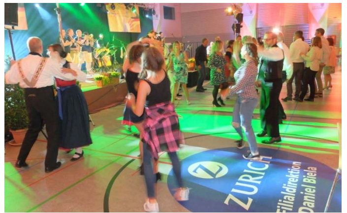
Der Abend endete mit Tanz und guter Unterhaltung der Band BliBlaBlasmusik.