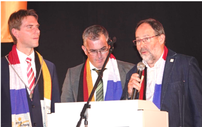
Am Abend folgte dann der offizielle Festakt.