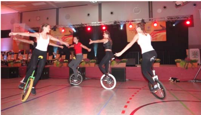
Im anschließenden Unterhaltungsteil unterhielten die Einradgruppe vom LFV mit einer akrobatischen Einlage...