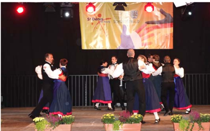
... die Trachtengruppe mit einer gelungenen Tanzaufführung...