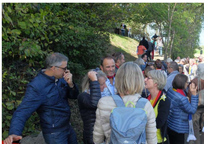
... ging es zu Schutterwalds höchster Erhebung...