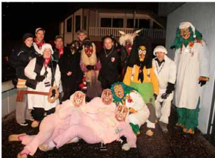
Tolles Engagement der Narrenzünfte